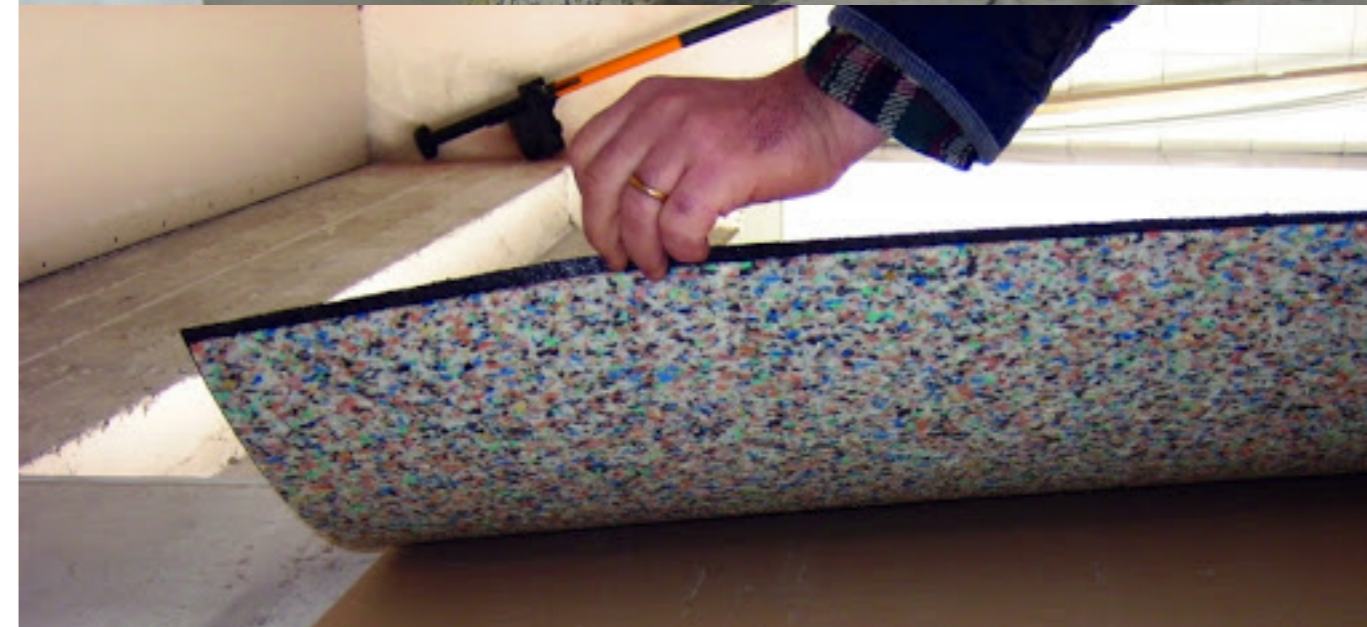
Le lastre isolanti in poliuretano riciclato sono di facile posa, sagomabili ed adattabili alle diverse forme dell'edificio