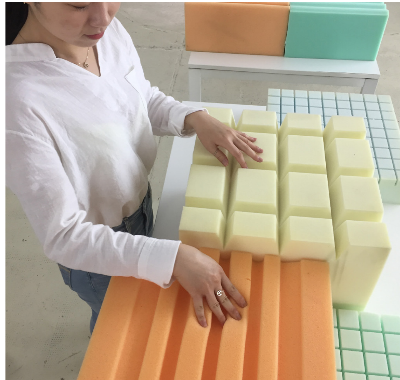
Provare le diverse tipologie di poliuretani tastandondoli e comprimendoli per percepirne le caratteristiche

Da questo semplice esercizio l'utente può ricavarne delle importanti sensazioni le quali, opportunamente valutate in base alle proprie abitudini, aiutano ad orientare le scelte verso un certo modello di materasso piuttosto che verso un altro.